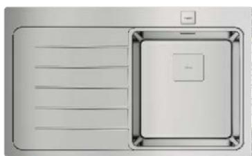
Zdjęcie: wersja z lewym ociekaczem